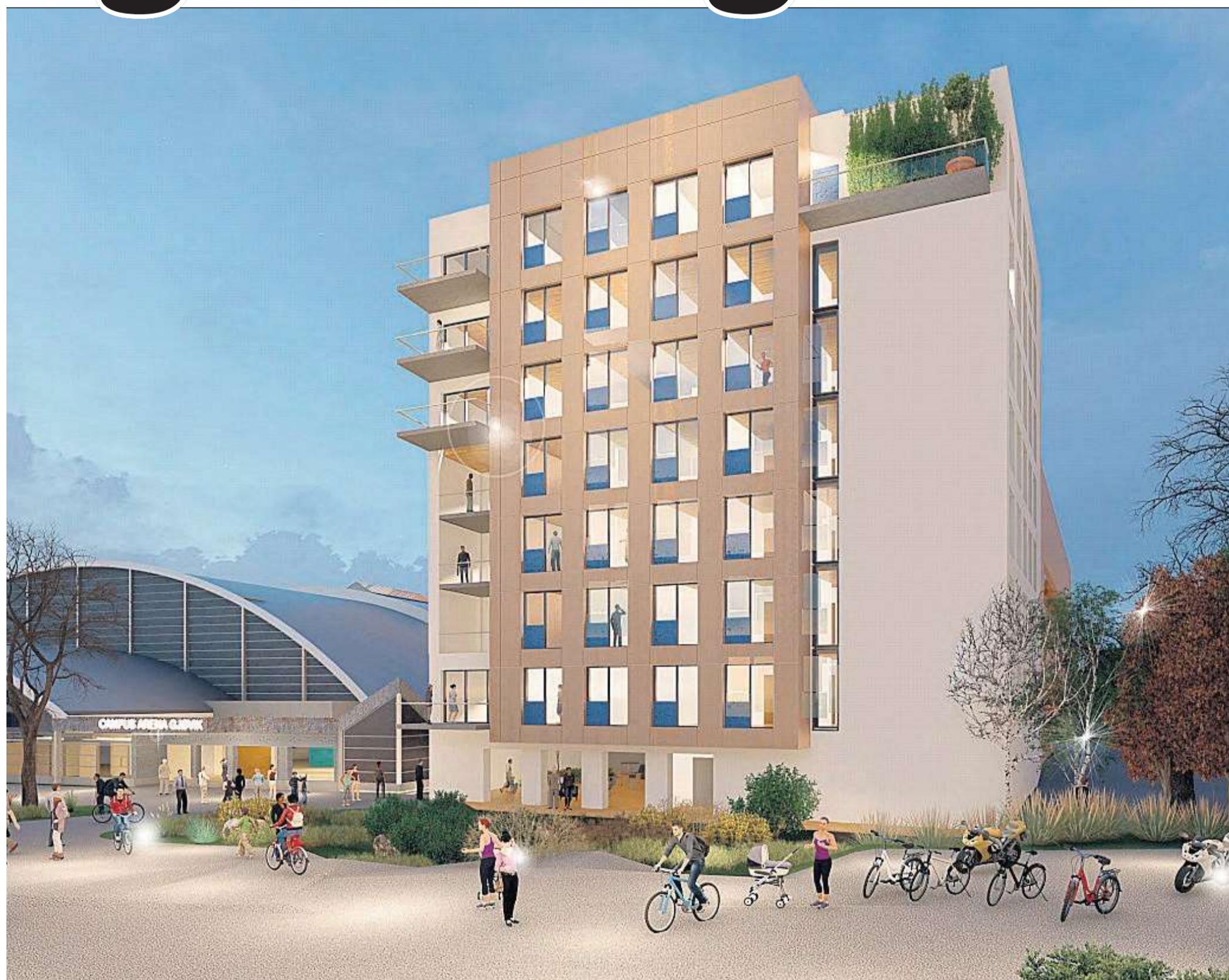
osjektet på Kallerud for seg et nytt bygg med 80 hybler.